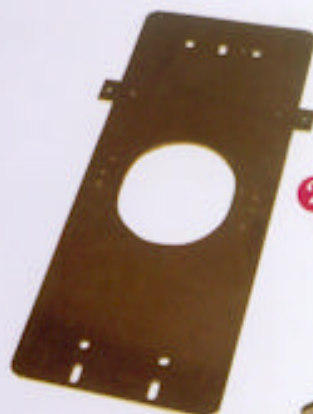
2 Carter d'éclairage