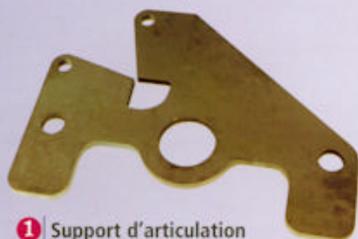
1 Support d'articulation