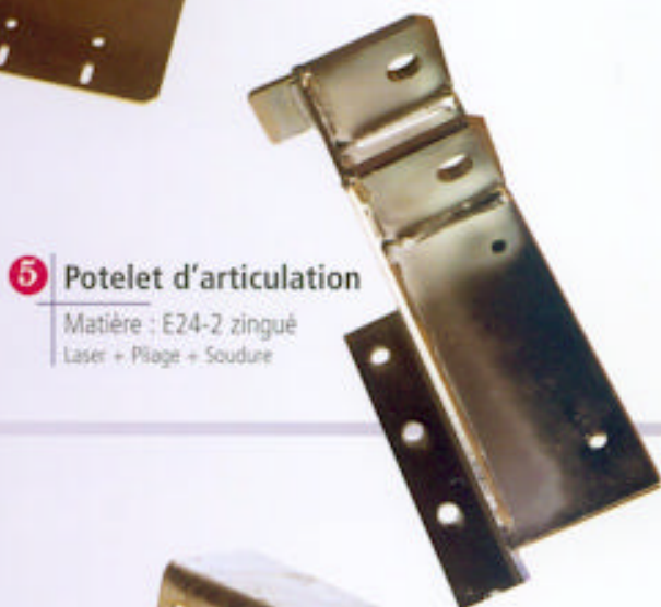
5 Potelet d'articulation

Matière : E24-2 zingué Laser + Pliage + Soudure