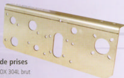
4 Support de prises

Matière : Alu 5754H111 brut Laser + Pliage