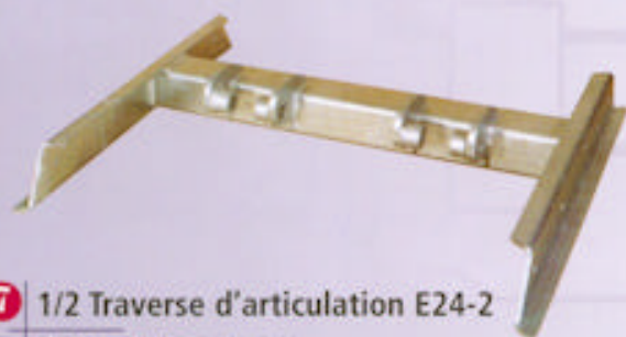
7 1/2 Traverse d'articulation E24-2

Matière : E24-2 galvanisé Laser + Cisailage + Poinçonnage + Pliage + Soudure