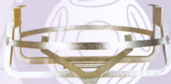
8 Support simple de roue de secours

Matière : E24-2 galvanisé Laser + Tronçonnage + Cisailage + Poinçonnage + Pliage + Soudure